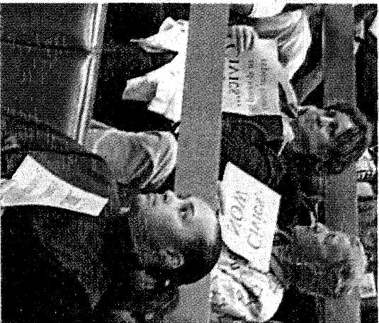
Padres apoyan acción.