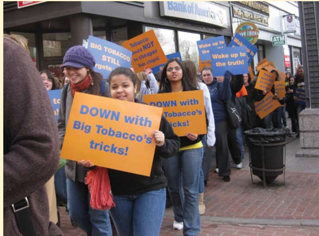
Teens in HSTF's Health Careers Ambassadors Program protest flavored tobacco that is marketed to young people.

This year, we significantly expanded our youth-led community education activities, reaching more than 250 local children via sustained and weekly activities in dance, music, and literacy. Young artists led dance workshops for local teens and visited area elementary schools to provide regular arts instruction to children who would otherwise not have access to it. Through our music program, we offered voice and instrumental lessons as well as numerous performance opportunities. Our youth also led literacy activities with younger children across the neighborhood, stressing topics such as proper nutrition and fitness habits. In all, HSTF youth partnered with dozens of other community