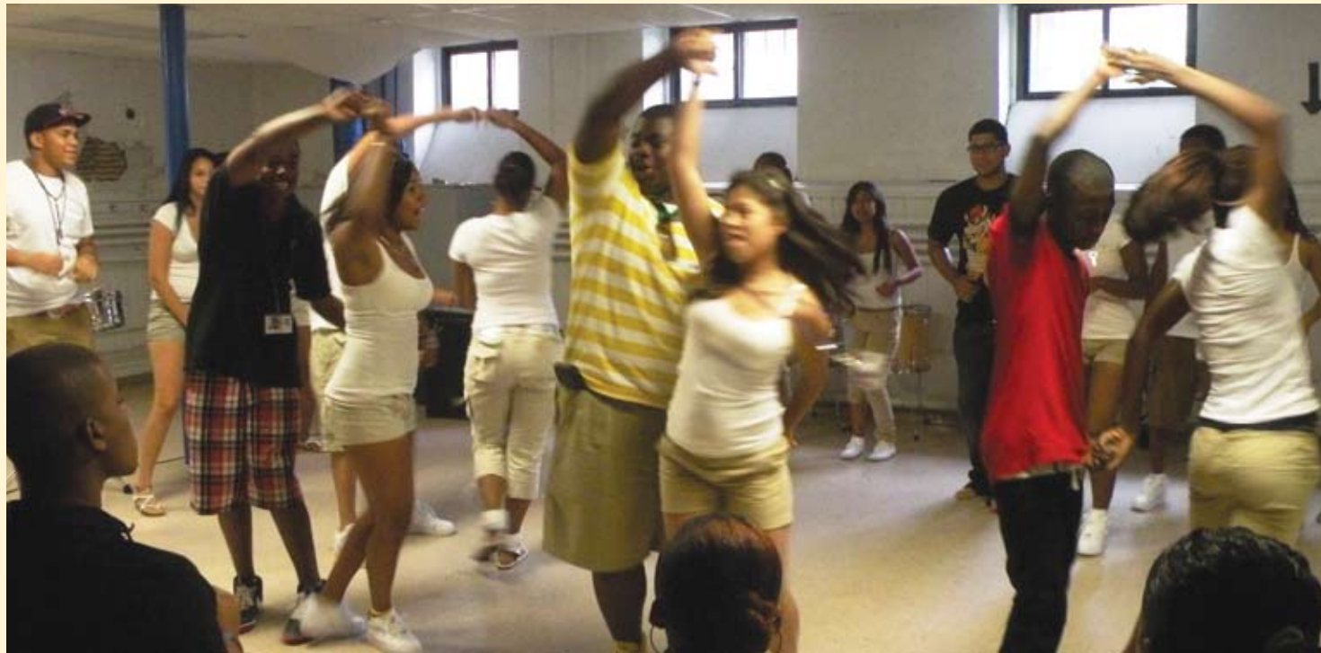
En el Comité, los jóvenes hacen ejercicios divertidos y culturalmente relevantes, y eso les enseña a trabajar juntos y desarrollar la confianza mutua. Aquí, los jóvenes aprenden a bailar Salsa durante el Instituto de Liderazgo de Verano.

Before our youth can become tomorrow's leaders, they have to go through basic training. The Summer Leadership Institute, conducted before the start of last school year, served as an opportunity for us to orient our youth to the organization, establish expectations, and introduce fundamental concepts that will guide their experiential learning over the next several years.